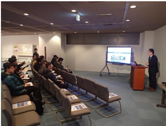
プラザ事業の紹介

館内では、「新技術普及支援」の一環として実施している技術展示（ショーケース）の紹介、また「S-WETS」（滋賀県水環境技術サービスデータベース（Shiga Water Environment Technology and Service Database））のデモ等を行い、関心を集めました。